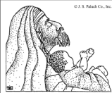
La Presentación del Señor